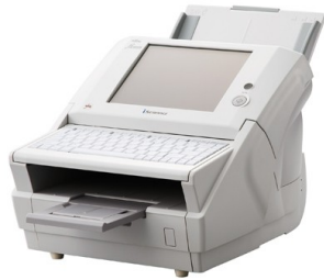
Netzwerkscanner Fujitsu fi-6010N

se bieten, wie auch die Multifunktionsgeräte, den Vorteil, dass sie ohne eigenen Scan-PC auskommen. In der Regel ist ein (Touch-) Display bzw. eine Tastatur im Scanner integriert, worüber die Bedienung erfolgt. Die Verarbeitung der Scandaten verläuft analog zum Scannen mit MFPs.